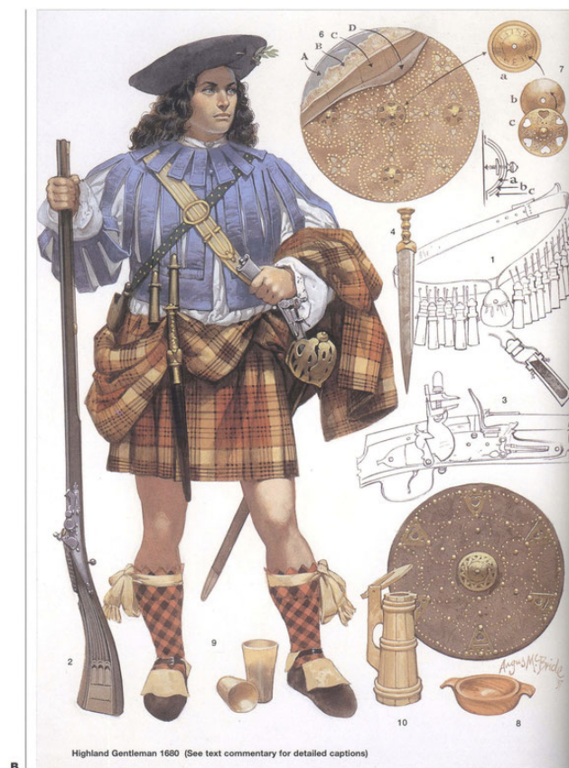
Highland Gentleman 1680 (See text commentary for detailed captions)

Tiens, tiens, il y a comme un air de famille ! Avec cette image, la pièce devient intéressante et sort immédiatement du tiroir pour passer sous les pinceaux.